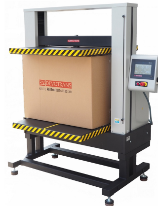
DVT GP D S80 N - TESTEUR DE RESISTANCE A L'ECRASEMENT POUR BOITES