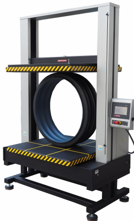
DVT GP D S100 N TESTEUR DE RIGIDITE ANNULAIRE POUR TUYAUX